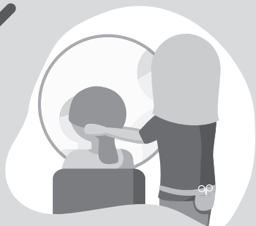
Beratung über den Spiegel