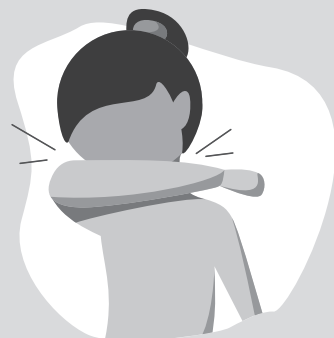
Hust- und Niesetikette beachten