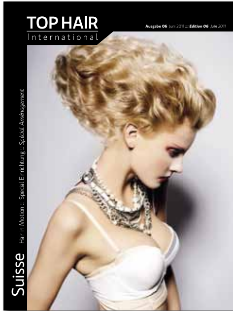
Das auflagenstarke Coiffeurmagazin für die Schweiz

TOP HAIR Suisse ist absolut führend in der redaktionellen Qualität und im gestalterischen Niveau: ein Anzeigenumfeld, das seinesgleichen sucht.